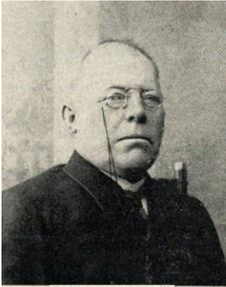
Johann Langemann www.gutenberg.org